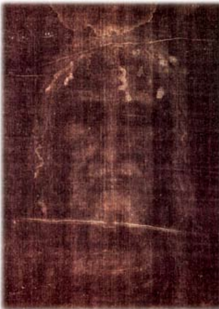
Na plátně je vidět tvář

„Toto vzácné Ježíšovo pohřební roucho,“ – řekl Svatý otec Jan Pavel II. – „nám může pomoci lépe pochopit tajemství Synovy lásky k nám. Když stojím před tímto výmluvným a šokujícím obrazem nepopsatelného utrpení, chci děkovat Bohu za jeho výjimečný dar, dar, který nemůže přehlédnout žádný z křesťanů toužících následovat Krista... Plátno nám umožňuje objevit tajemství utrpení posvátné oběti Ježíše Krista, utrpení, které se stalo zdrojem spásy pro celé lidstvo“ (Turín, 24. května 1998).