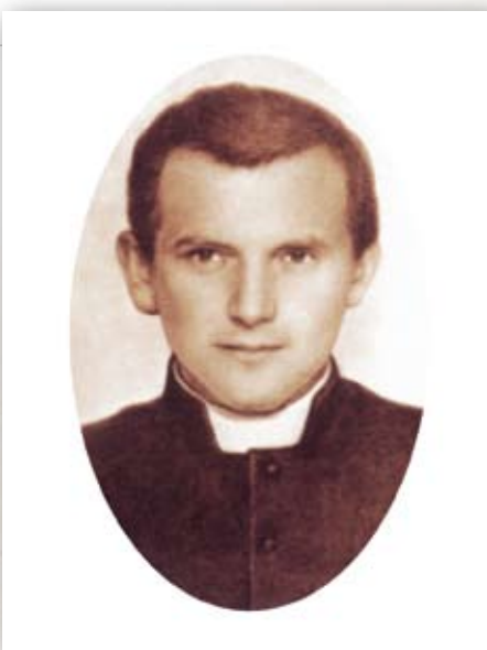
Karol Wojtyła, bohoslovec

Právě díky Tyranowskému Karol poprvé ve svém životě sáhl po nejnád-