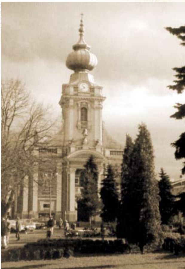
Farní kostel ve Wadowicích